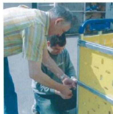
Travaux pratiques pour un moniteur de l'ESAT et un travailleur handicapé.